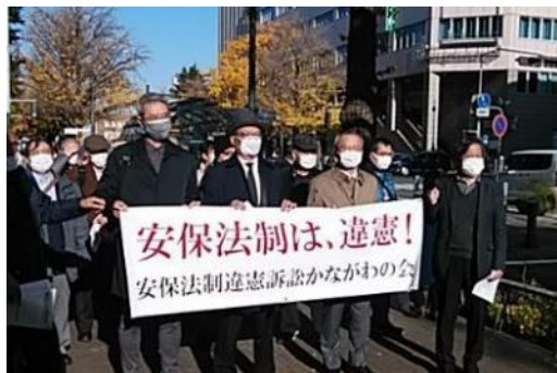
図1 裁判所前での行進

傍聴希望者の抽選があったが、私は外れたので、報告集会の開かれる波止場会館に向かいました。私はこれまで何度も法廷に入って傍聴する機会を得ており、機会の少なかった方には傍聴券が渡されました。