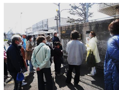
図3 GNF-J前で説明を聞く参加者