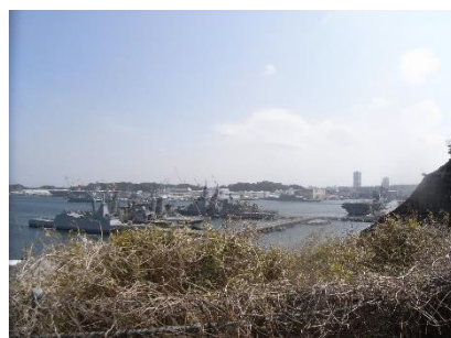
図1 横須賀軍港。左に米海軍の、右に海上自衛隊の艦船が見える。