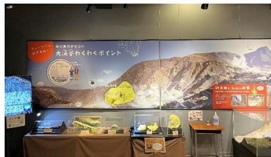
図3 博物館の大涌谷の展示

費用： 博物館利用料、自然研究路協力金、保険代・資料代を合わせて1000円、交通費実費。案内：箱根ジオミュージアム学芸員。主催：地学団体研究会神奈川支部 申込み；自然研究路は参加者全員の事前登録が必要です。当方で予約しますので、参加希望者は4月20日までに電話またはメールで、氏名、フリガナ、性別、年齢、電話またはメールアドレスをお知らせください。