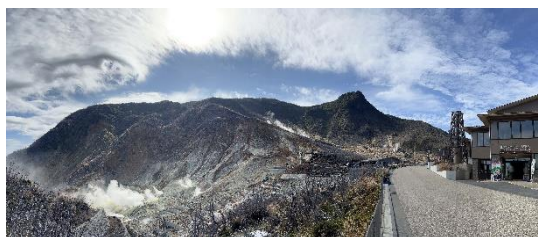
図 1 左は大涌谷、中央は冠が岳、右は博物館

コース： 小田原発 10:08 の登山鉄道、箱根湯本発 10:25 の登山鉄道、強羅発 11:8 のケーブルカー、早雲山発 11:22 のロープウェイで大涌谷着 11:37。11 時 45 分から 12 時 30 分まで箱根ジオミュージアムの見学。昼食後、