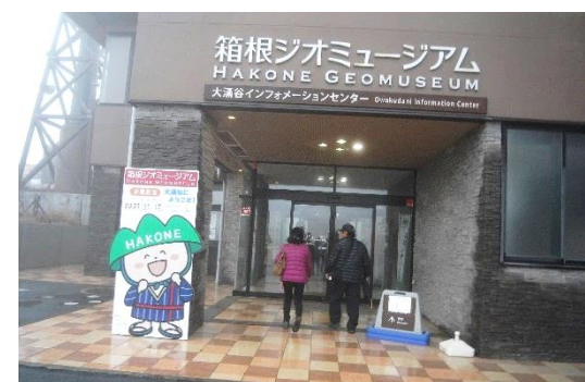
図 2 博物館の入口、黒たまご館 1 階