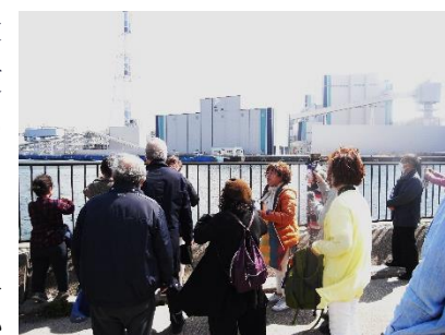
図4 石炭火力発電所で説明を聞く